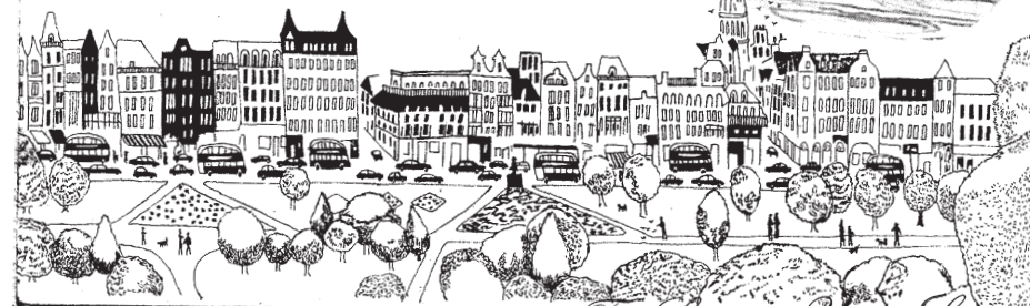
The Sound of Young Scotland